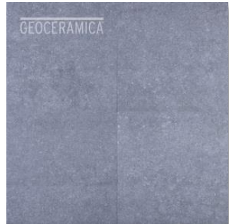
2Drive Gris Claro

FORMAT 60/60/6 cm – pour trafic léger, voiture de tourisme – 86.40 CHF/M2