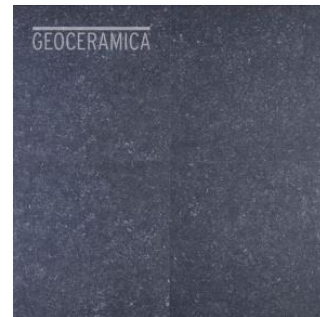
2Drive Negro Puro